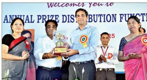
आज समाज नेटवर्क